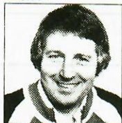
SIPPMANNHALTER 3facher Staatsmeister Leitwagen